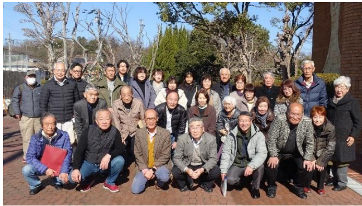
新役員のみなさま

◆去年12月に建替えたが、共同受 信設備について知らなかった。 【回答】住宅を建替えたり、新築す る場合は「環境保全チェックシ ート」を出してほしい。そこに共同 受信設備に関する記載さ れています。