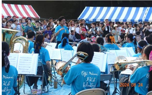
王寺南義務教育学校吹奏楽部

この頃には、グラウンドは人でいっぱい。どの模擬店でも長蛇の列。特に人気の焼きそばやから揚げなどは20mにも及ぶ列で皆さんお行儀よく並んでいました。