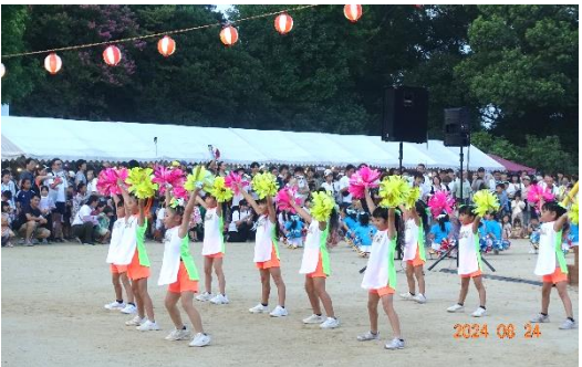
キッズチャリディング

次のプログラムは皆さんお待ち兼ねのビンゴゲームの始まりです。ニンテンドースイッチ獲得を目指して、皆さんビンゴカードを握りしめ、真剣に取り組んでいました。最後のプログラムは盆ダンス、盆踊りです。かわいい踊り子たちが、リズムカルに元気よく楽しそうに踊っていました。