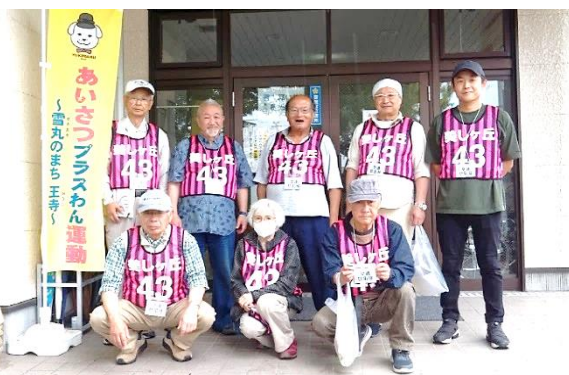
交通防犯部の皆さん

あまりにも迷惑駐車や交通マナーが酷くなると警察としては取り締まりを強化せざるを得なくなります。そうならない様に、美しヶ丘の住民一人一人が交通マナーを守り、これからも住みよい街づくりを目指していきましょう。