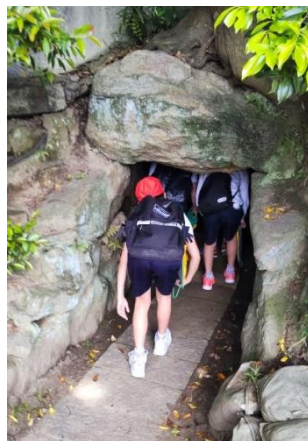
達磨寺1号古墳を探検

達磨寺、片岡王寺跡、芦田池、永福寺、火幡神社、乳たれ地藏等、王寺町の名所旧跡を巡りました。普段通り慣れている道でも古くから由緒ある史跡があり、改めて歴史がある町だと感じていました。自分たちが住む町のことを興味を持って知ってほしいものです。